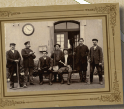
Des cheminots devant l'ancienne gare de Thanvillé.